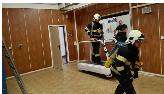
Výcvik jednotky požární ochrany