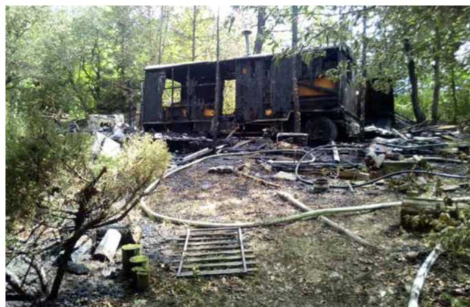
Po zásahu JPO 5.7.2019 v Čisovicích