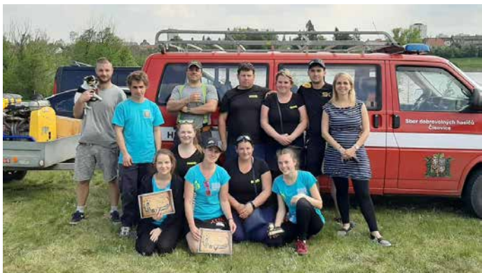
Soutěž o pohár starosty - Dobříš

Sto a k tomu čtyřicet let. Úctyhodný věk dobrovolného spolku. Ano, letos to je právě 140 let od chvíle, kdy zakladatelé čisovického hasičského sboru zahájili spolkovou činnost. Již mnoho generací přicházelo, pokračovalo v činnosti a zase předávalo žezlo těm, kteří přicházeli po nich. Čisovický sbor, třetí nejstarší na okrese, přežil všechny nástrahy, které historie přichystala. Útlak orgánů Rakouska – Uherska, dvě světové války, krize, totalitní režimy, to vše, byť nikoliv bez úhon a ztrát, náš sbor přečkal, aby mohl v lepších dobách opět rozvíjet svou činnost. Jsme dědicové dlouhé a bohaté tradice, převzali jsme sbor, který má za sebou čtrnáct dekad činnosti, a je naší povinností přenést jej přes všechny nešvary dnešní doby tak, aby i ti, kdo jednou přijdou po nás, mohli navazovat na slavnou a bohatou tradici. To není jen prázdná věta, to je skutečný závazek – a myslím si, že současný sbor se rozhodně nemá zač stydět.