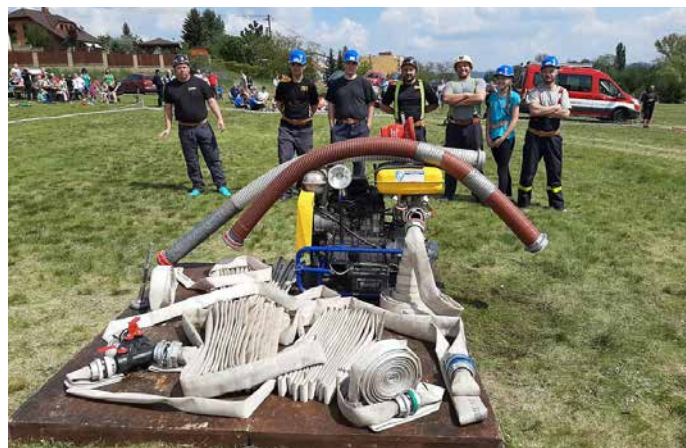
Soutěž o pohár starosty - Dobříš květen 2019