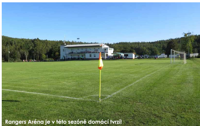
Rangers Aréna je v této sezóně domácí tvrzí!