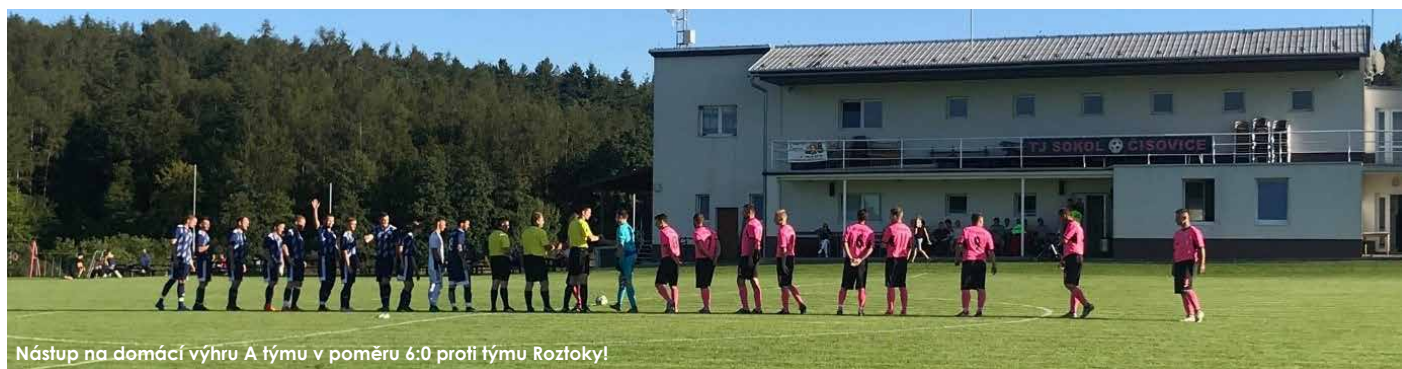
Nástup na domácí výhru A týmu v poměru 6:0 proti týmu Roztoky!

Hráči TJ Sokol Čisovice vstoupili do nové sezóny podle představ. Po úvodní remíze 2:2 hrají ve skvělé formě. V domácí Rangers Aréně jsou zatím neporaženi a mohou se tak těšit 1. místu v tabulce okresního přeboru. Rezerva si užívá účinkování ve IV. třídě a především na domácím hřišti těší diváky pěkným fotbalem. Ještě zbývají naši nejmenší. Starší přípravka pod vedením trenérů Petra Mathausera a Josefa Prachaře sbírá cenné zkušenosti. Potěšením pro další práci je především jejich radost ze hry. Do konce podzimní části nás čekají důležité duely. Přijďte fandit, nebo alespoň na dálku držte palce. Let's go Rangers!