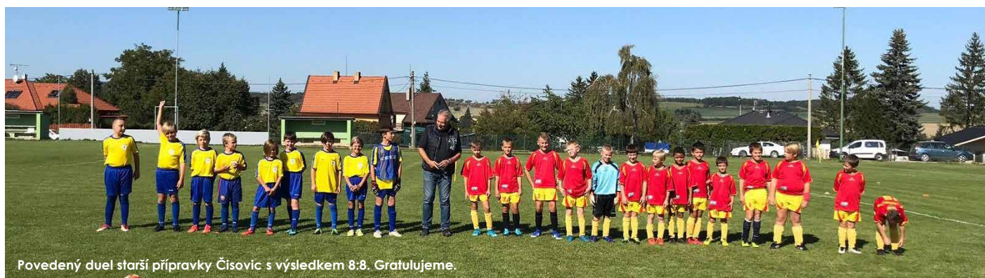
Povedený duel starší přípravky Čisovic s výsledkem 8:8. Gratulujeme.