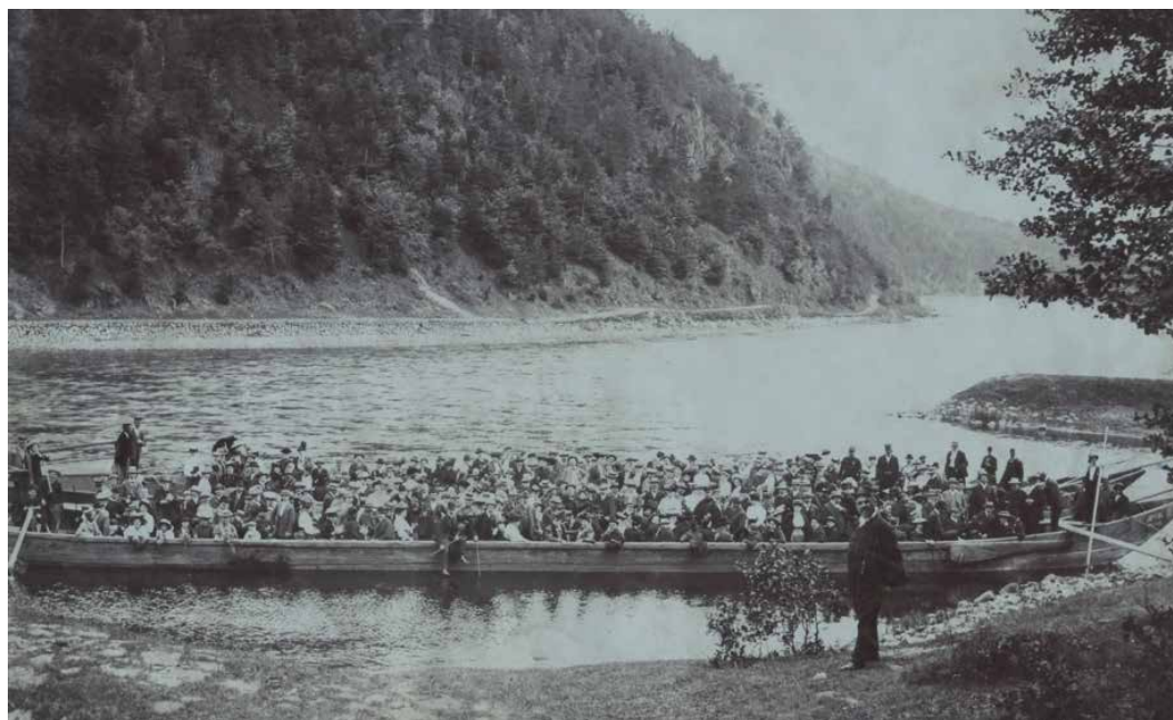
Turistické plavby Svatojánskými proudy do Štěchovic. Hlava na hlavě, takový byl zájem!

zvláštních, k tomu přizpůsobených šífech, kterým se říkalo „šenák“. Na upravený šif se podle jeho velikosti vešlo 50 až 200 výletníků, kteří od hovorných průvodců si rádi vyslechli veselé i často hrůzostrašné plavecké historky. Plavba začínala nad Horním slapem u hotelu Záhoří a do Štěchovic trvala zhruba hodinu. Ve Štěchovicích pak výletníci přestoupili na parník Pražské paroplavby, který je dovezl do Prahy.