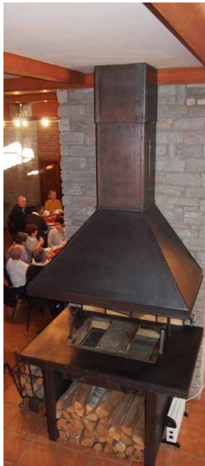
Z nahlledu vynikne zdejší strop nebo třeba stylový gril

Na druhé straně si pak nelze nevšimnout, kterak si co do věku pro někoho odepsaní strejci udržují kondičku rekreačním sportem, zatímco jejich stále ještě „drahé polovičky“ klidně v pětasedmdesáti jezdí na přednášky Univerzity třetího věku, která je součástí systému celoživotního vzdělávání na půdě vysokých škol. A jsou to vesměs právě senioři, kteří si to štrádají po znače-