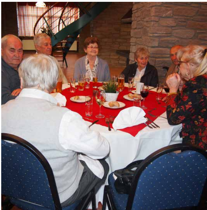
Čím je člověk starší, tím víc je o čem povídat, že?

ka. Všichni ti, kteří už nějaký čas pobírají penzi, něco pamatují, mají zkušenosti, nepreberně zážitků, ale i vůli „osladit si“ dny všední i sváteční, a to i v pokročilejším věku – ale to jsme přece říkali už na začátku. Tedy přesně taková, jací se na sklonku minulého roku sešli „u Filípků“ v řítecké Usedlosti Veselka.