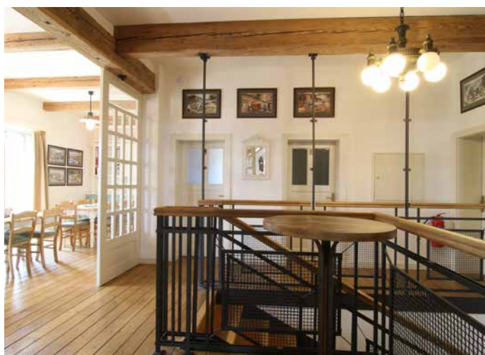
„Pivovar jsme se snažili vyzdobit stylově s ohledem na architekturu budovy, zároveň jsme do doplňků promítli i lásku k historickým vozidlům.“