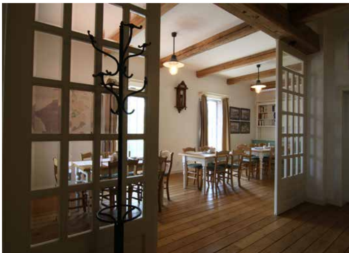
„Salónek slouží k oslavám nebo i školení zaměstnanců.“

trochu navoněný nápoj, používají se tam jiné druhy chmele a sladů - je to moderní. Ve většinové produkci zůstáváme u našich zavedených ležáků, které mají typické české suroviny a rodí se tradičními postupy.