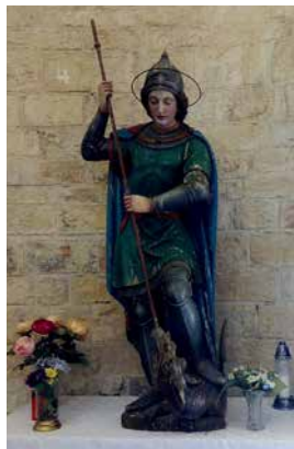
Sv. Jiří – patron románské stavby – má i svou sochu v interiéru rotundy