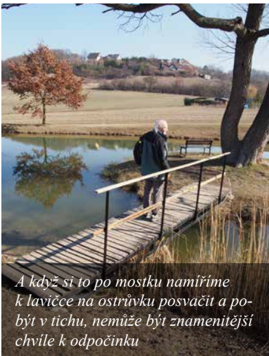
A když si to po mostku namíříme k lavičce na ostrůvku posvátit a pobýt v tichu, nemůže být znamenitější chvíle k odpočinku