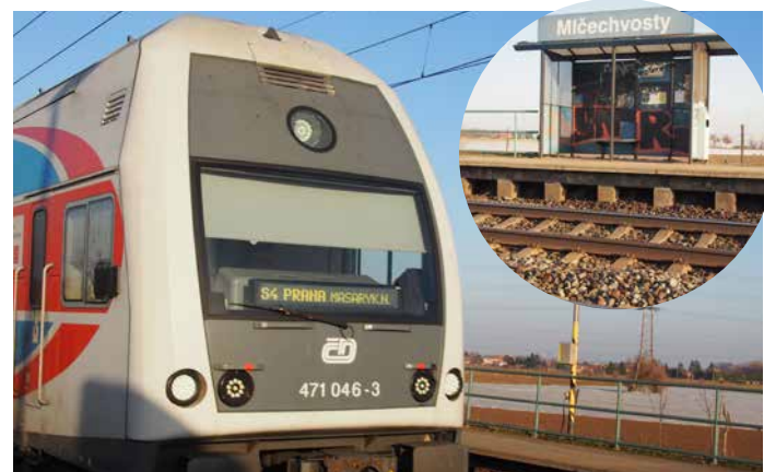
A z Mlčechvosty jsme za hodinku a pět minut „na Masaryče“