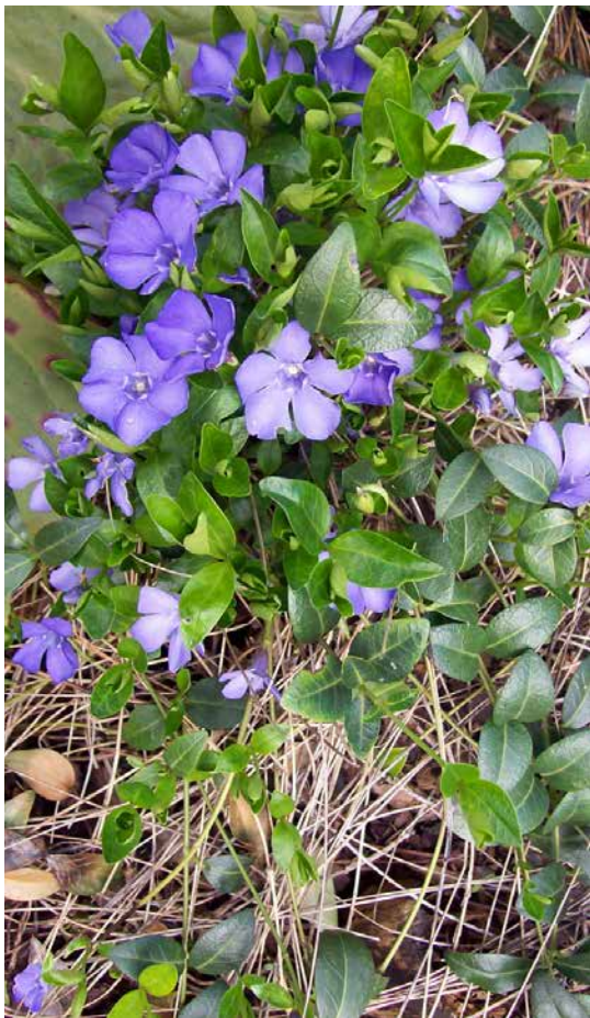
A k rybníku se vrátí brčál, který sem odedávna patřil, protože má rád stín i polostín. Nezapomeňme, že je to jen prastarý název pro barvínek, jaký máme mnozí z nás na svých zahrádkách či zahradách