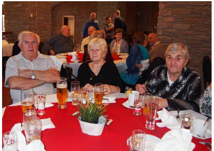
Jako sladká tečka zakončil malé hody větrník, takže klidně mohli přijít pivečko, červené či bílé víno, nealko nápoje a kdo chtěl – káva