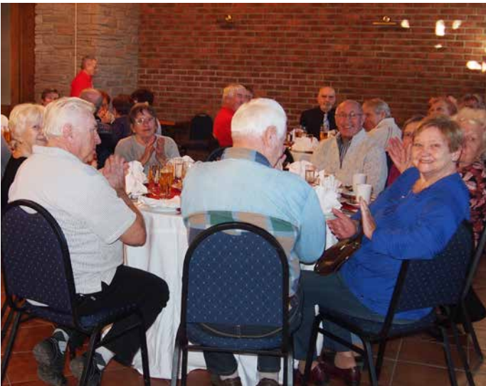
Však taky jakmile kapela uvedla do provozu noty, přítomní ji odměnili potleskem