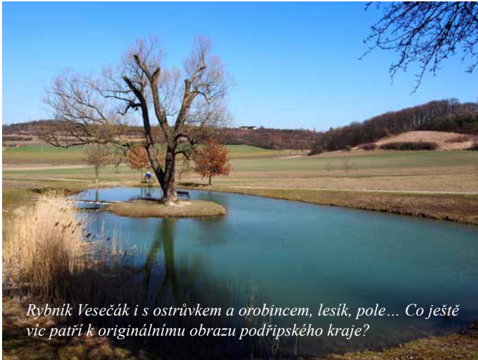
Rybník Vesečák i s ostrůvkem a orobincem, lesík, pole... Co ještě víc patří k originálnímu obrazu podřipského kraje?