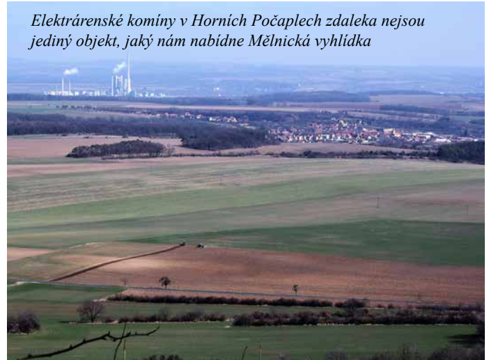
Elektrárenské komíny v Horních Počaplech zdaleka nejsou jediný objekt, jaký nám nabídne Mělnická vyhlídka

se tu rozplývali nad ostře žlutým květem vzácného teplomilného křivatece českého . Tehdy už uvadal, proto jsme si pro ilustraci vypůjčili archivní snímek. Chlácholíme se, že to je kvůli rozhledům, ale Mělnická vyhlídka nám přijde vhod už proto, abychom si drobet „orazili“. A stojí za to: támhle je Rovné, od-