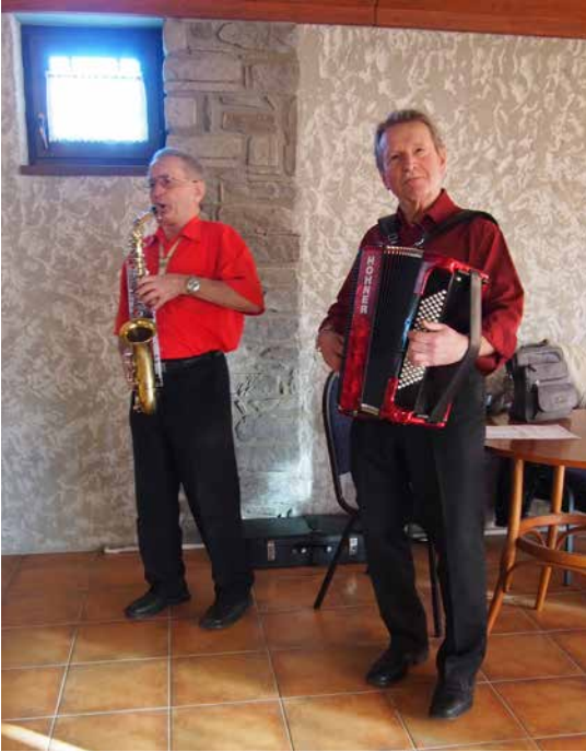
Život se holt bez stárnutí neobejde a zábava bez pořádné muziky jakbysmet!