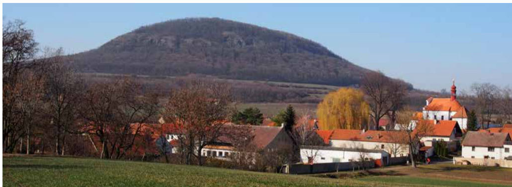
...a Ctiněves ještě jednou, tentokrát s živou kulisou nejčestějšího symbolu, jemuž se přezdívá prs úrodné matky země