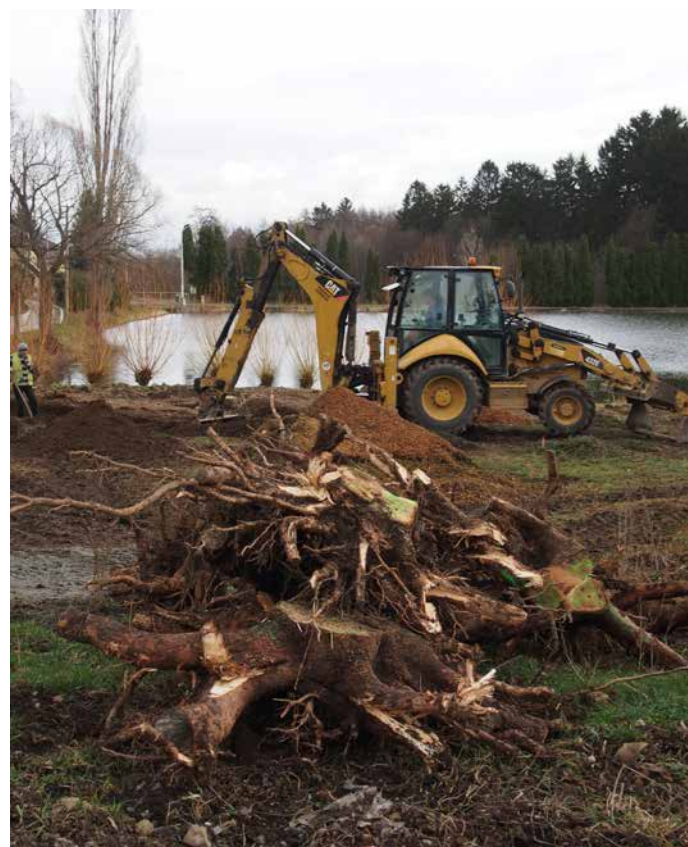
Těžká technika si s terénem dokáže poradit – zbytek je na ruční práci...