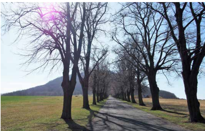
Od vesničky Rovné nás k temeni opěvané hory doprovází lipová alej – přírodní architektonické dílo člověka. Jde o velmi starou tradici, která je v naší krajině doložena už v době vlády Karla IV.