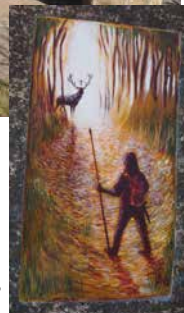
Lidová tvořivost „vtesaná“ do kamene