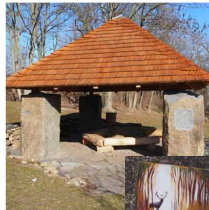
Nad stylovým odpočívadlem u Ctiňevsi se vznáší málo pravděpodobné přání: Stolečku, prostři se!

k dva roky starému zastřešenému odpočívadlu z kamenných kvádrů, s přílehlým rybníčkem, jen skok od Ctiňevsi. A tady musíme uctít alespoň fragment z Čechova „životabytí“ v této lokalitě. No – v této fázi spíš nebytí..., neboť: „Když se praotcův život naplnil, na hranici ho důstojně spálili, popel do hrobu dali. Na hrob mohyly nakladli, hrob navštěvovali, tu plakali a klaněli se, žehnajíce vojvodovi svému; a jméno jeho šlo od pokolení do pokolení. Za čas pak na tom místě ves postavili a v počtivost toho hrobu Ctiňovos jí jméno dali.“ Tolik dnes ještě jednou Alois Jirásek.