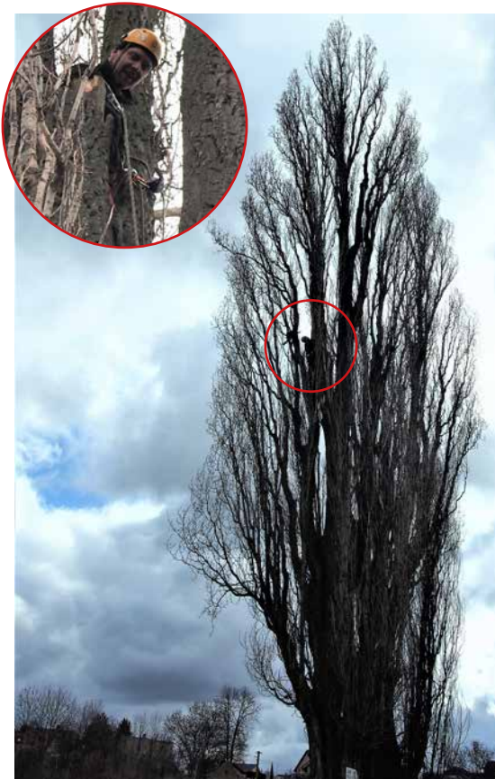
Muž ztrácející se v koruně prořezává letitý, ale respekt vzbuzující topol u rybníka