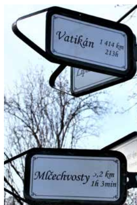
Vatikán půl druhého tisíce kilometrů? Pojďme raději do Mlčechvost, odtamtud nám jezdí vlaky domů...

Tak akorát jsme skoro všechny naše velikány, kteří v Mlčechvostech provozovali češtví na nejvyšší úrovni, stačili vyjmenovat a už nám z vlakového nádražička, i tak posprejovaného až hrůza, otvírá dveře souprava, která ve všední dny mezi třináctou a osmnáctou odpoledne spolehlivě jezdí každou hodinu a o víkendech „ob spoj“. Z pražského Masarykova nádraží už třefíme i poslepu.