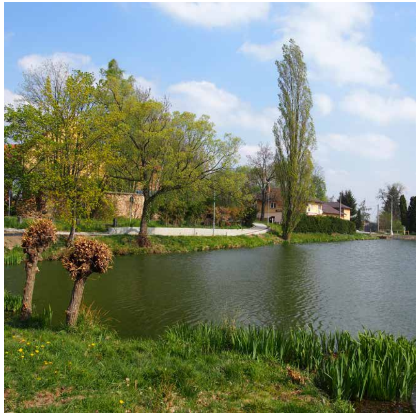
Partie u říteckého rybníka už není tak nepřírozeně zahuštěná jako před zahradní úpravou