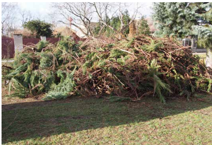
Hromadu větví z nepůvodních dřevin za obecním úřadem pověřeni pracovníci brzy odstranili

na zdravotním stavu. S tím neuděláme nic!