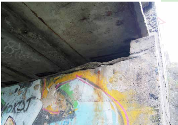
Malůvky samozvaných „výtvarníků“ jsou prachobyčejným vandalským, zato odpadávající kusy železobetonu už nás můžou děsit...

Co se týče konečného řešení dopravní obslužnosti, tak cestující budou s předstihem informováni (ROPID, dopravce, obec). První pracovní jednání k řešení této situace se uskutečnilo v pondělí 29. 4. 2019 za účasti starostek a starostů dotčených obcí, představitelů IDSK, ROPID a přepravce).