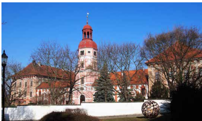
Velkolepou barokní perlu v Roudnici nad Labem Lobkovicům záviděli mnozí páni. Však jim taky stavba zabrala dlouhých třicet let!