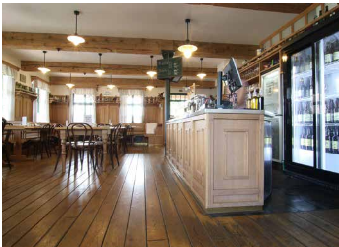
„Přízemí restaurace, které je otevřeno návštěvníkům každý den. Zajímavostí jsou historické trámy dovezené z bývalé sladovny ve Skuhrově.“