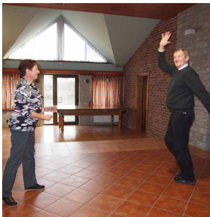
...takhle divoká taneční figura dokázala rozostřit i čočku fotoaparátu