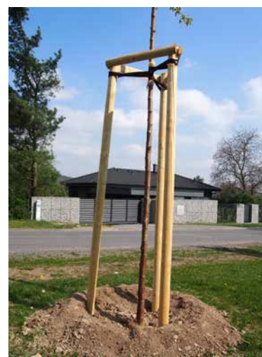
Rovněž Sportovní ulice dostala nový – přívětivější háv a vysazené stromky bytelnou oporou