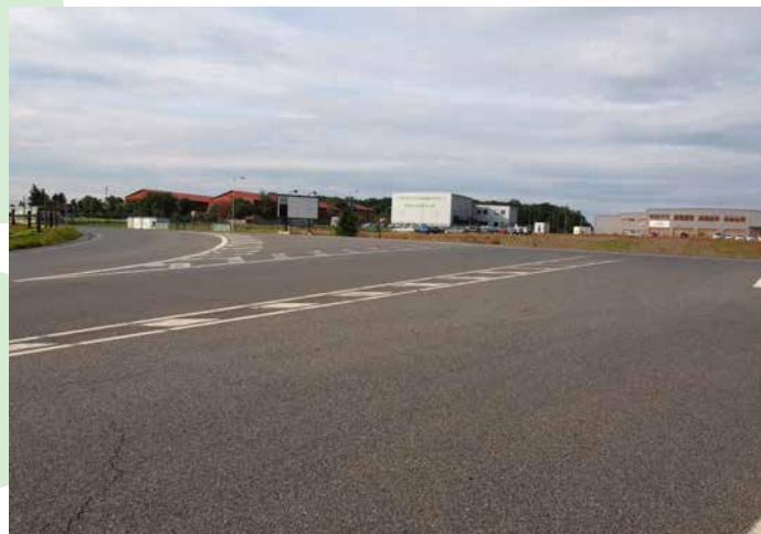
Křižovatka za mostem teď zažije pěkné „tůčo“, protože vpravo – tedy na most – se nedostaneme