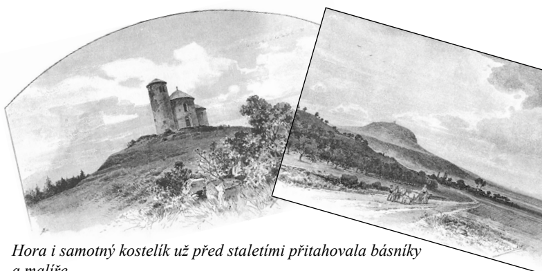
Hora i samotný kostelík už před staletími přitahovala básníky a malíře