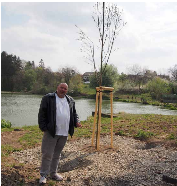
Mlatová cesta bude bytelně zpevněna kovovými bočnicemi