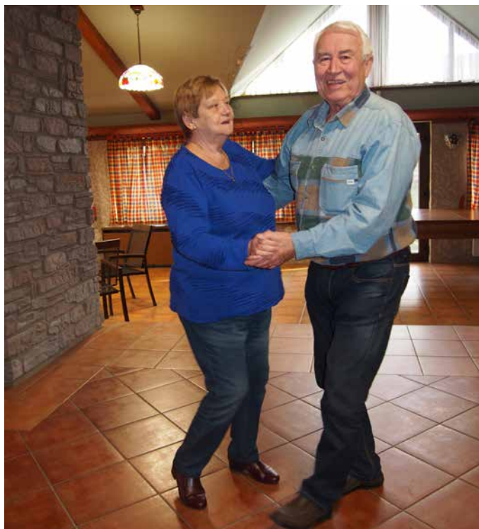
Manželé Brabencovi jako první roztančili sál...

s rachitickým, tedy nedužným vzezřením kuřáka nejen obyčejných cigaret, nebo človíček, který se prostě neumí srovnat se svým bytím.