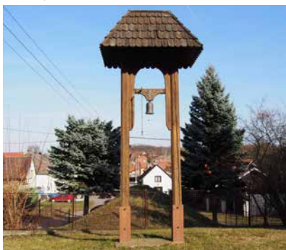
Kdo by si nechtěl zatahat za šňůrku dřevěné zvoničky v Jevíněvi a zazvonit?