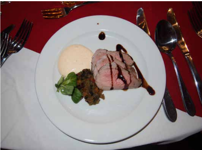
... aby naservirovali náramně chutný rostbif. Jenže to byl jen předkrm – jak je vidět podle sady příborů, všechny ostatní dobroty teprve měly přijít...