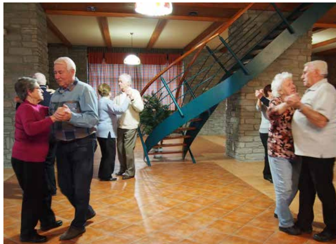
Zatímco někteří si na dlaždicovém „parketu“ vedli v celkem poklidném tempu...