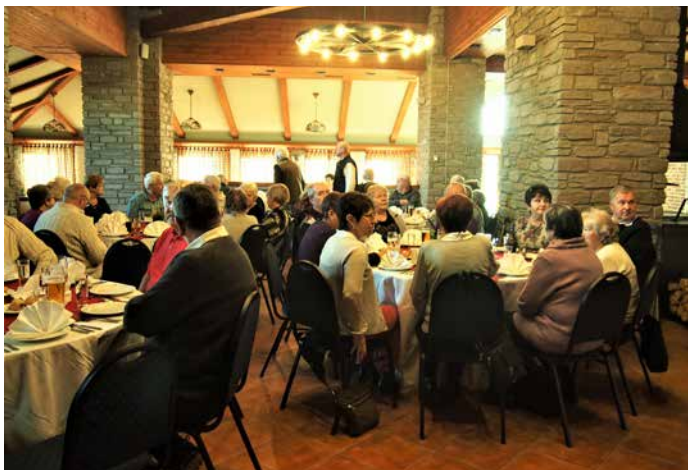
V příjemně vytopeném, komfortním a útulném prostředí Usedlosti Veselka bylo to odpoledne a podvečer seniors doslova „natřískáno“!

Mnohý takový „starobní důchodce“ leckdy vypadá mnohem líp než příkladně ani ne padesátiletým životem uvláčená bytost