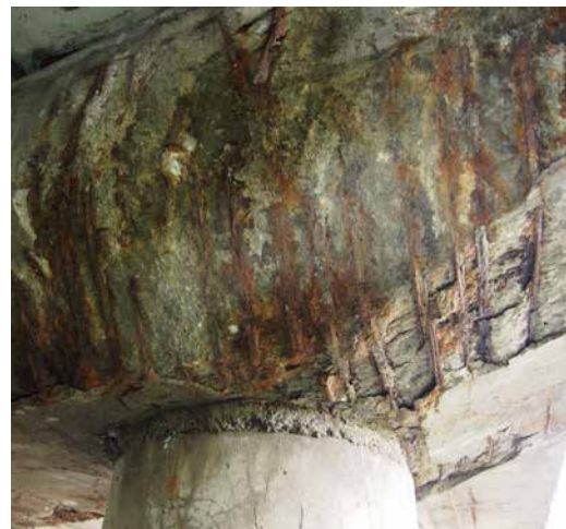
... ale ani pohled odspodu nás nijak neuklidní!