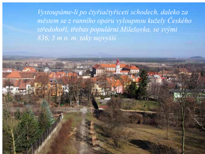
Vystoupáme-li po čtyřiačtyřiceti schodech, daleko za městem se z ranního oparu vyloupnou kužely Českého středohoří, třeba populární Milešovka, se svými 836, 5 m n. m. taky nejvyšší

V slabounce mlžném oparu už se před námi v plné kráse zobrazil typický zvonovitý tvar Řípu. Abychom věděli, po čem budeme