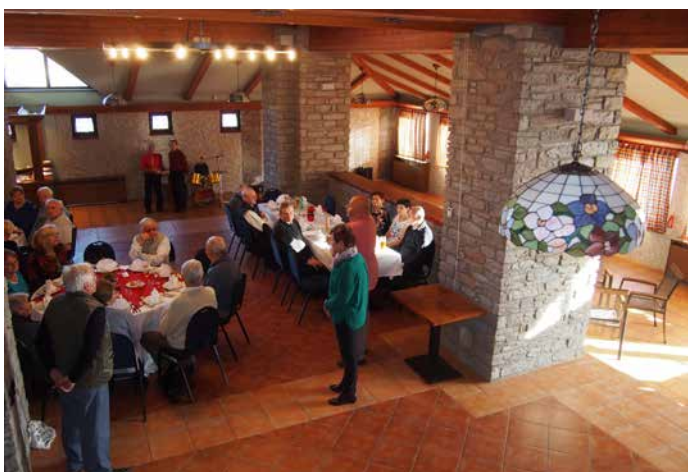
Dřevo, kámen i luxusní osvětlení, to je jen zlomek skvostného interiéru „u Filípků“

jsme si řekli – jsou mnohem mladší než v době našich dědů, pradědů, takže skutečný věk nám neznámého člověka mezi pětáctýřiceti a sedmdesáti lety se často spolehlivě určit ani nedá. Senior tudíž vůbec nemusí být ten starý chlap (babka) . Třebas pro řadu těch, kteří se nad pojmem senior zastaví, slovo představuje prostě přestárlost, stařeckost, což platí zejména tam, kde se svými rodiči či prarodiči lidé nebydlí. A to už je úplně scestný pohled na realitu.