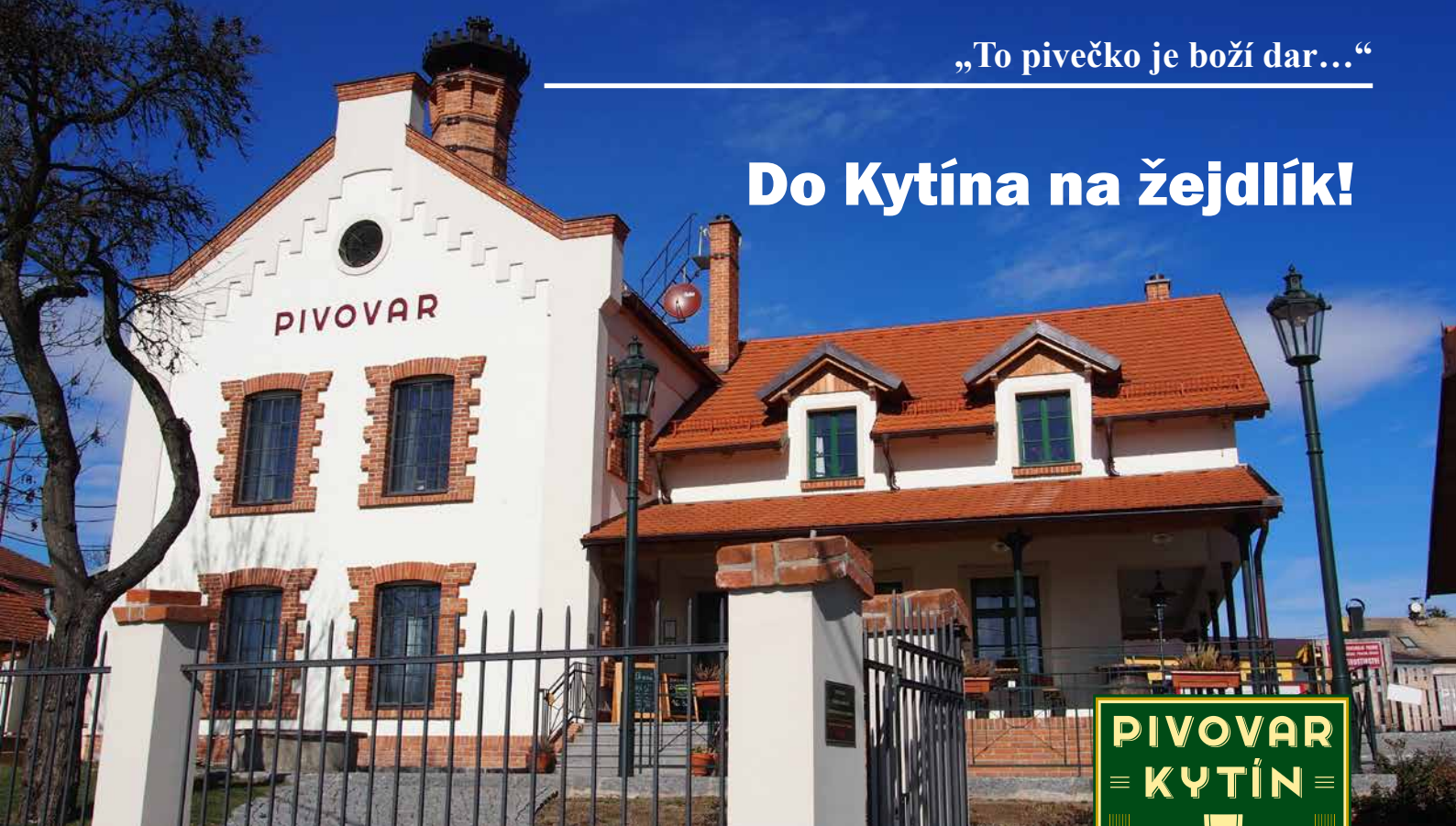
Průčelí Kytínského pivovaru zarámované jarním nebem