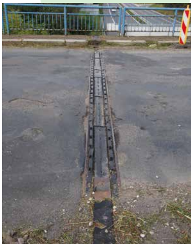
V dezolátním stavu je nejen vozovka mostu...

Předpokládaná doba prací na novém mostě je plánována cel-