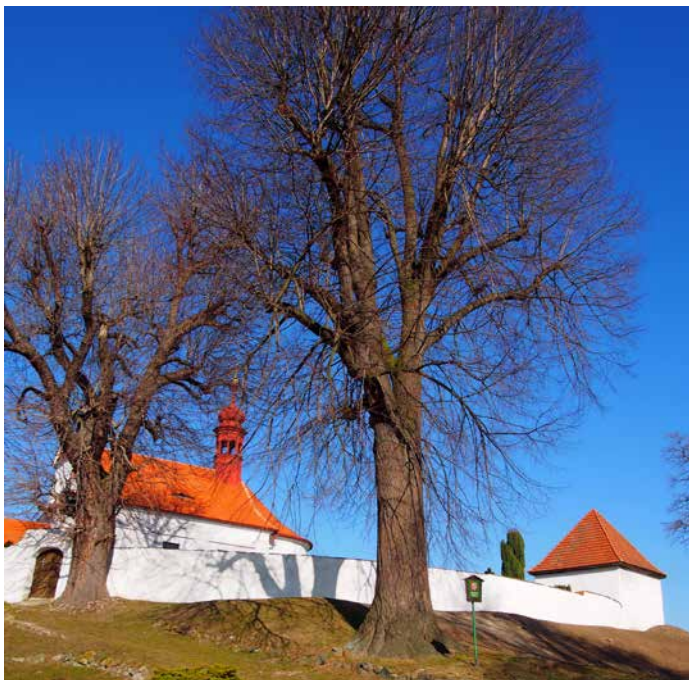
Ctiněves – domnělé pohřebiště praotce Čecha – zdobí památná lípa i dvacetimetrový kaštan u kostela sv. Matouše...