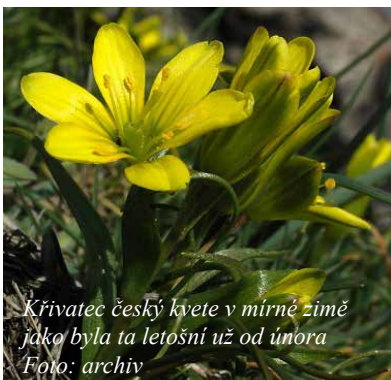
Křivatec český kvete v mírné zimě jako byla ta letošní už od února