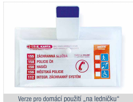
Verze pro domácí použití „na ledničku“

Byla spoluvyvořena projektem Senioři v krajích Ministerstva práce a sociálních věcí ČR a Jihomoravským krajem, především s tamní zdravotnickou záchrannou službou (ZZS) a dalšími složkami IZS v červnu 2018, jako výstup kulatého stolu Stárneme ve zdraví. Díky projektu Senioři v krajích je distribuována po celé ČR. Na základě zpětné vazby na „domácí“ verzi nyní vznikla také MINI „cestovní“ varianta do peněženky.