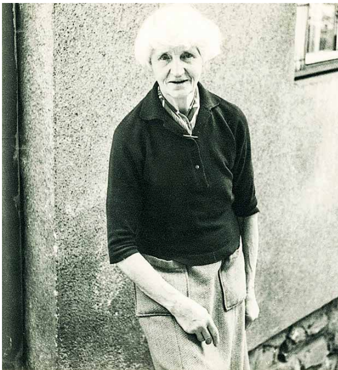
Lata před chatou v Klínci

Příštích devět let se Velká pardubická v důsledku politických událostí a druhé světové války nekonala. Řítecký statek byl během války pod německou nucenou správou a po skončení války bylo jeho hospodářství téměř vydrancované. Tak Lata zaplatila za to, že se zařadila k minoritní části aristokratů, kteří během války stáli při českém národu.