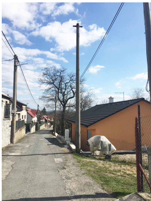
Před opravou (foceno r. 2019)