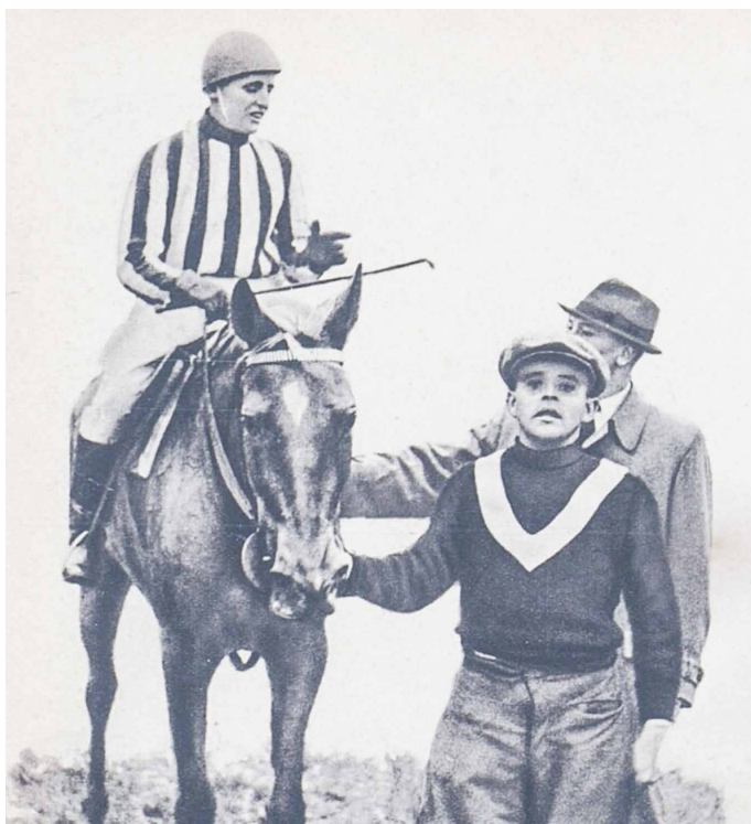
Lata po vítězné steeplechase; Zdroj: Eva. Praha: Melantrich, 1937, roč. 10, č. 1.

V minulém čísle Zpravodaje jsem v závěru svého příspěvku na straně 13 vyřknul (spíše hypoteticky) otázku ohledně určité osoby. Několik z vás správně poznalo, o koho se jedná, a předpokládám, že správných odpovědí bylo mezi vámi více, i když druhá část otázky už byla opravdu hodně těžká. Dnešní příspěvek přináší odpovědi na obě části dotazu.