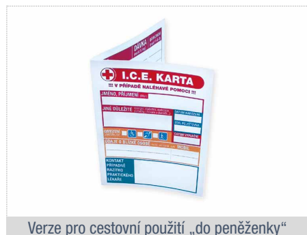
Verze pro cestovní použití „do peněženky“