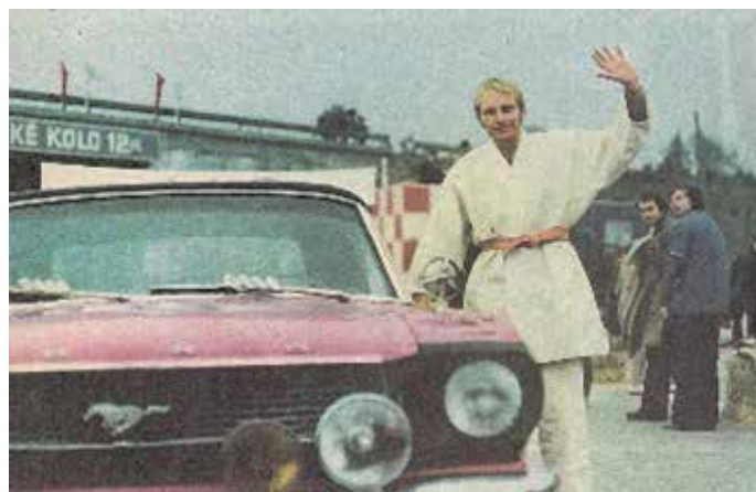
Jáchyme, hod' ho do stroje!

Stejně místo u podjezdu si zahrálo také ve filmu Chobotnice z II. patra z roku 1986 režiséra Jindřicha Poláka. Hned na začátku filmu se vracejí Pavel Zedníček a Jiří Kodet coby řidiči kamionu z Francie domů, ale západní zemědělci právě stávkují, vytvářejí blokády na silnicích a všude zuří rajčatová válka. Ve filmu chtějí kamionem dojet jistou boční silnicí