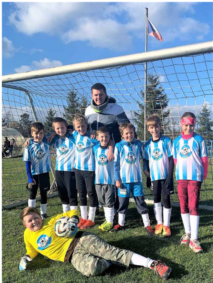
Starší přípravka před zápasem s FC Přední Kopanina