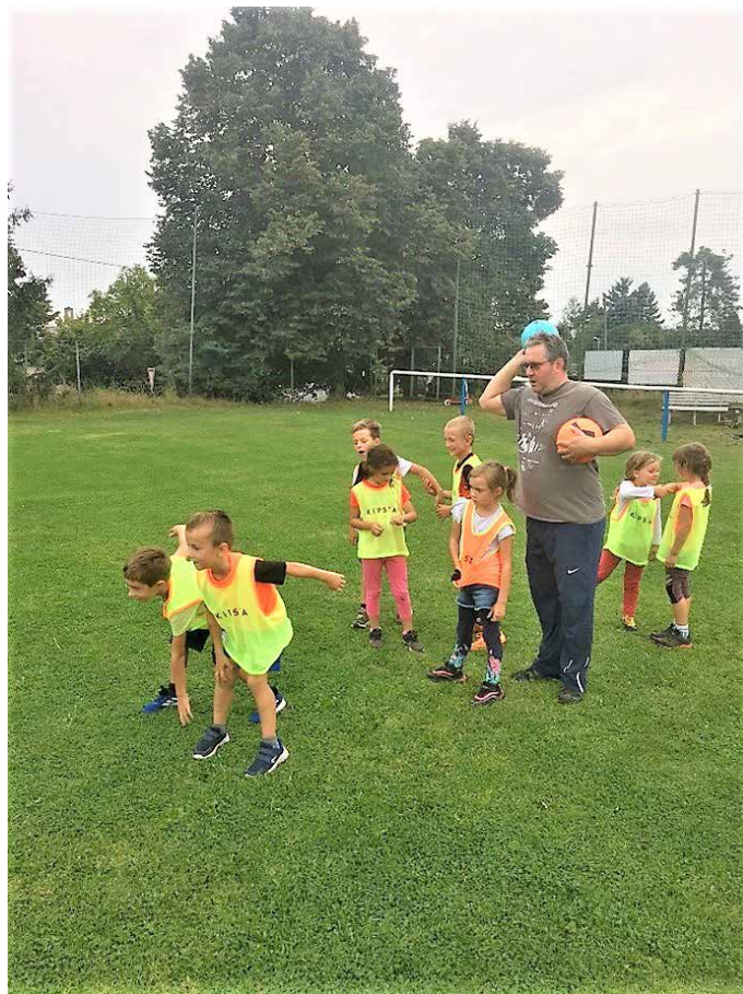
trénink Mladší přípravka TJ Klíneec 1930

Malí fotbalisté a fotbalistky pilně trénovali celé září a říjen dvakrát týdně vždy v pondělí a ve středu na hřišti v Klínci, kde se jim trenéři snažili vštěpovat základy fotbalového umění podle přístupu, který je postavený na principech smysluplného drilování řetězce herních činností a je spojený s manipulačními činnostmi s míčem, jako je zpracování a převzetí míče, prudkost a přesnost přihrávky, důraz na první dotyk, a který je také spojen s nácvikem obcházení soupeře. V rámci výuky se dbá i na doplňkové pohybové aktivity, které probíhají bez míče a jež podporují všestranný tělesný rozvoj. Že děti tréninky baví, potvrzuje fakt, že žádné z nich doposud neskončilo, ba