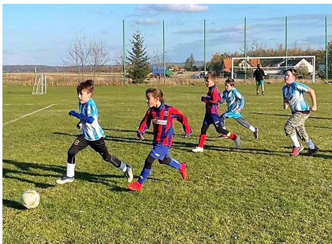
momentka ze zápasu Starší přípravky s FC Přední Kopanina