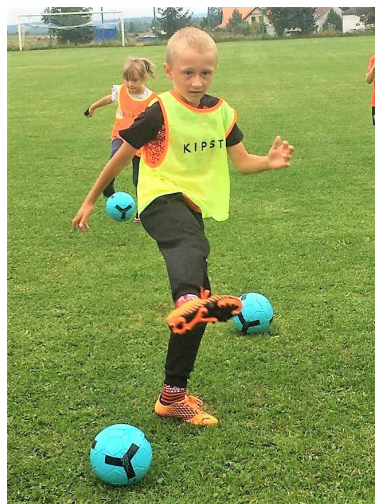
trénink Mladší přípravka TJ Klíneec 1930

naopak jsme přivítali ještě několik nových členů.