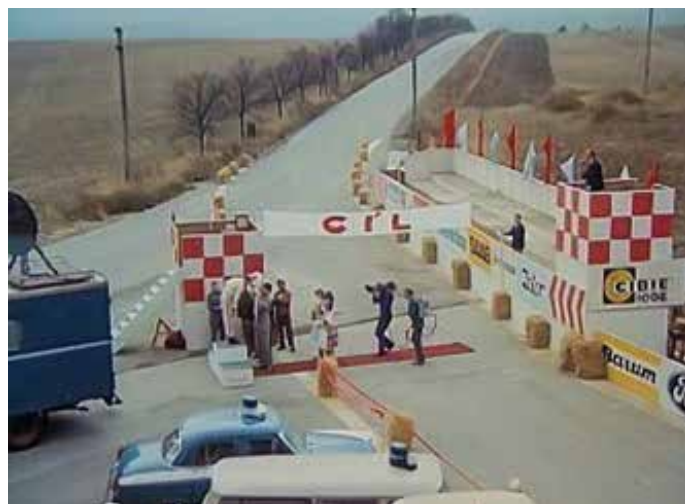
Z filmu Jáchyme, hod' ho do stroje! (1974)

bilem na slavnost na zámek Konopiště. Tím vypůjčeným vozem je sportovní Ford Mustang a po cestě se s ním nedopatřením připele do automobilového závodu, ve kterém navíc zvítězí. Start i cíl závodu filmaři situovali do křižovatky u dálničního podjezdu všensorské silnice. Tady se také Petr Nárožný, jako věhlasný automobilový závodník Volejník, dožaduje opakování ceremoniálu, protože to je přeci on, kdo závod správně vyhrál. To už ale po silnici od Klínce přijíždí sanitka, zřízenci ho naloží a odváží jej do blázince, v domnění, že se jedná o hledaného Koudelku. Dálnice tehdy ještě zářila novotou a násep okolo podjezdu je na filmových záběrech zcela holý. Dnes už je sice hustě porostlý vegetací, ale jinak se místo do dnešní doby příliš nezměnilo.