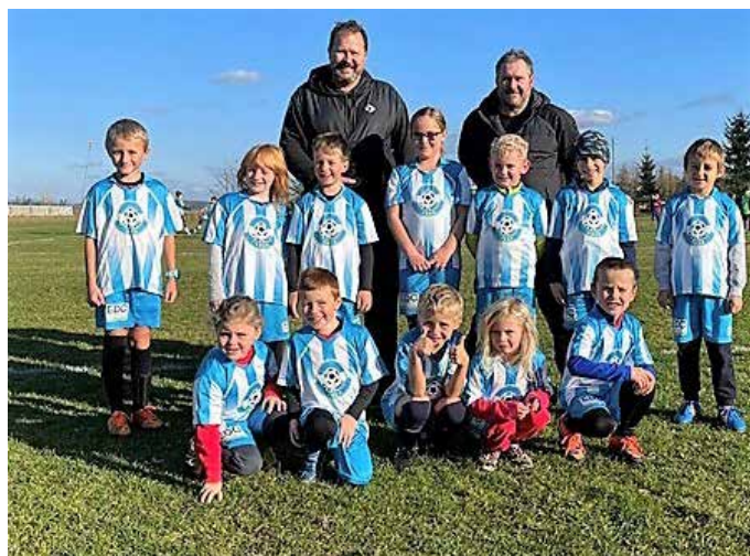
Mladší přípravka před zápasem s FC Přední Kopanina