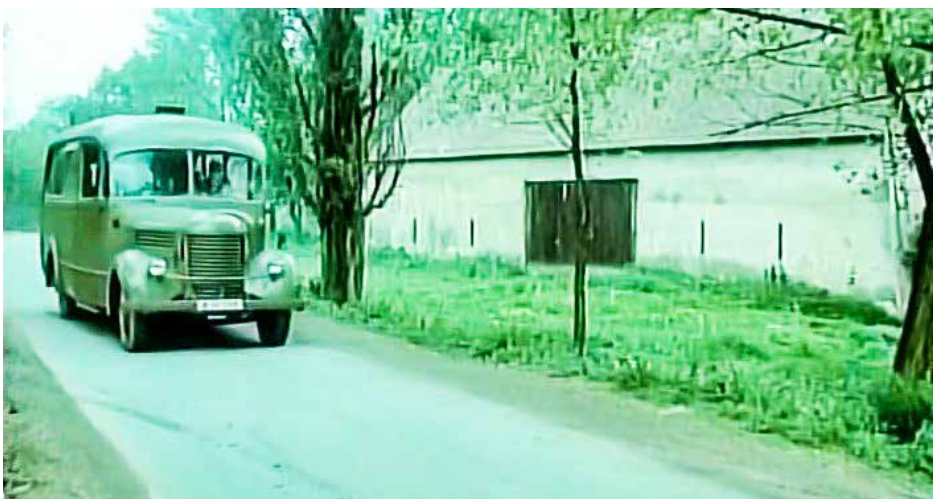
Z filmu Tam, kde hnízdí čápi (1975)