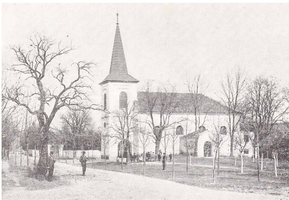
Kostel v Trnové okolo roku 1900

východním okraji skalního výběžku. Tam je ale před námi ještě kus cesty, takže půjdeme dál. Po 100 metrech od vchodu do dvorany zámečku se dostaneme na prostranství k Trnovské krčmě. Její základy byly položeny tehdejším majitelem trnovského velkostatku, Janem Ferdinandem ze Schönfeldu, který tady v roce 1791 (uvádí se i rok 1790) založil první rolnickou školu v Čechách.