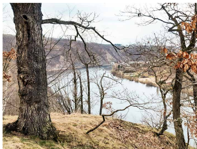
Vyhlídka z Kazatelny na sever