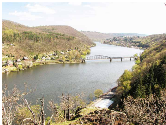
Vyhlídka z Kazatelny na jih

Po dalších 100 metrech od Trnovské krčmy se dáme doprava, po místní cestě ze zámkové dlažby. Na jejím konci musí naše kroky mířit vpravo na louku, kde nás cesta povede dál, až za ohradou vstoupí do lesa, přesněji řečeno, do toho, co z lesa zbylo. Abychom se dostali k první vyhlídce, je třeba za další ohradou sejít z lesní cesty doprava, kde podél okraje rokle vede nekomfortní úzká vyšlapaná pěšinka, která nás ale neomylně dovede až na vyhlídku na jihovýchodním okraji Kazatelny. Ze skalního výběžku je krásný