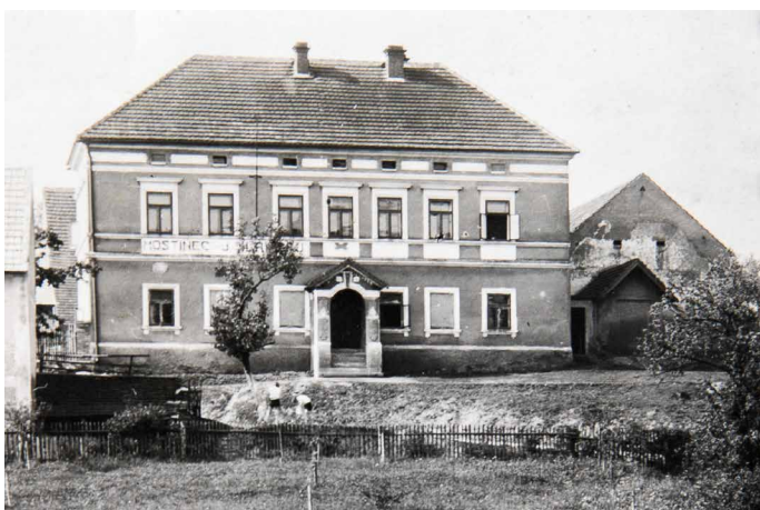
Hostinec U Slavičků, před rokem 1934.