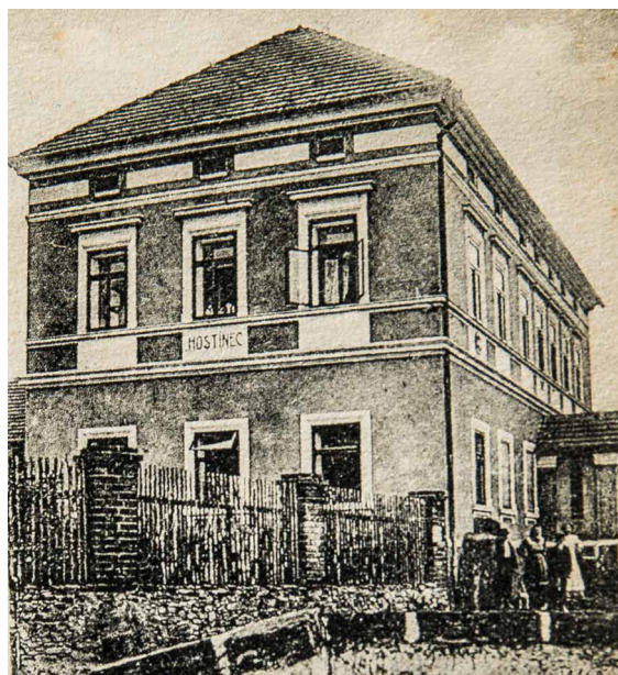
Hostinec U Slavičků, kolem roku 1910.