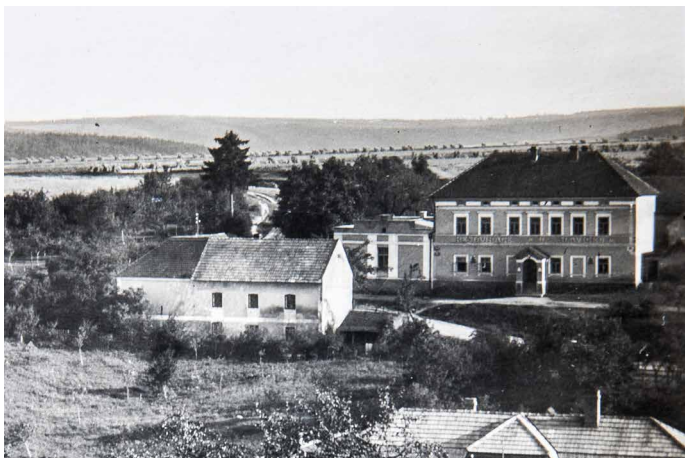
Hostinec U Slavíčků s přístavbou tanečního sálu, kolem roku 1940.

Dřívější stavební podoba usedlosti není dnes známa, přes veškerou snahu se mi nepodařilo dohledat žádný dobový popis stavby. Jediné, co lze s určitostí zjistit, je půdorysná podoba usedlosti, která téměř korespondovala se současným stavem, tzn. půdorys je ve tvaru U se dvorem otevřeným na východní straně. Hlavní vchod do obytné budovy byl ze dvora.